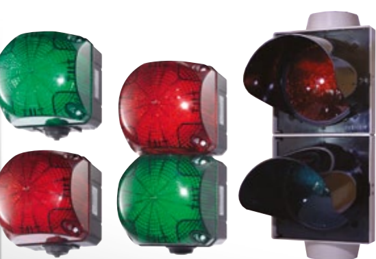
Светофор — стандарт: 24 В Светофор — опция: 230 В